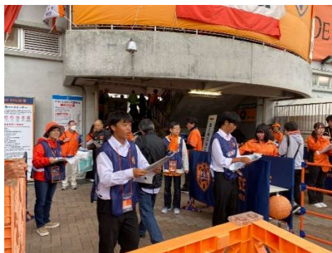
エスパルスとの連携 障害者スポーツ (清水桜が丘)