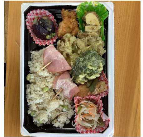
清水の自慢弁当(清水特支)