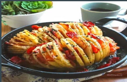
ハッセルバックポテト